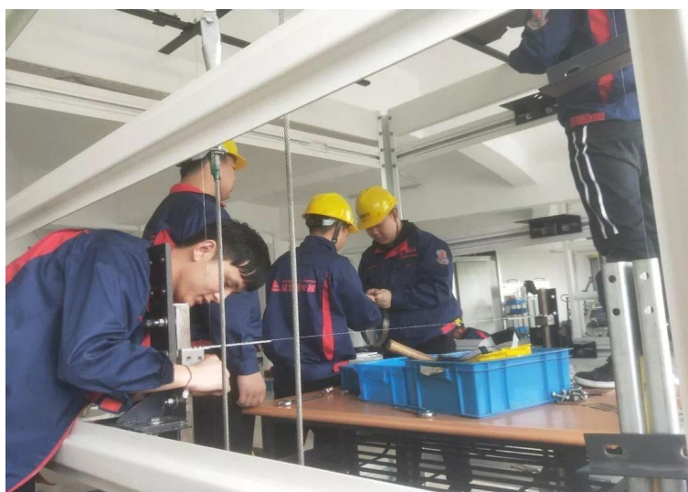
图9 学生在学习上海爱登堡电梯有限公司