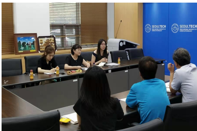
图 12 国际交流学院院长到韩国大学交流学习

开展“研学活动”。2018年12月，我校组织3名教师、34名学生开展了为期一周的寒假韩国研学活动。“读万卷书，行万里路”，此次研学活动，从韩国看世界，学习韩国文化，了解韩国历史，感受韩国的教育理念，让学生真正沉浸在游学的快乐当中，同时也开拓了教师的国际视野，提高了教师的教学能力与水平。