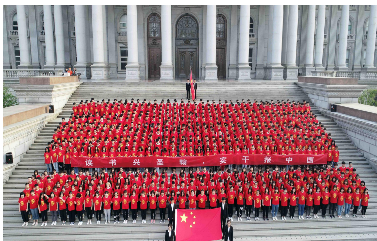
图 3 五四合唱比赛现场