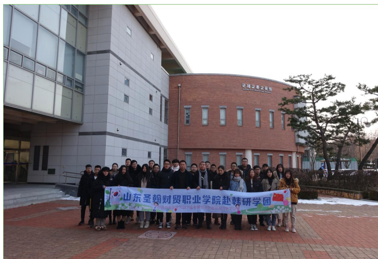
图 13 我校学生赴韩研学团

开展“研学活动”。2018年12月，我校组织3名教师、34名学生开展了为期一周的寒假韩国研学活动。“读万卷书，行万里路”，此次研学活动，从韩国看世界，学习韩国文化，了解韩国历史，感受韩国的教育理念，让学生真正沉浸在游学的快乐当中，同时也开拓了教师的国际视野，提高了教师的教学能力与水平。