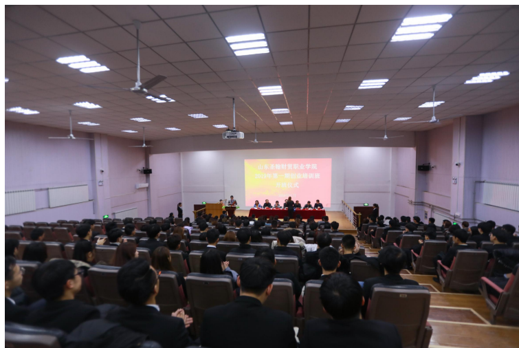
图 8 创业培训现场