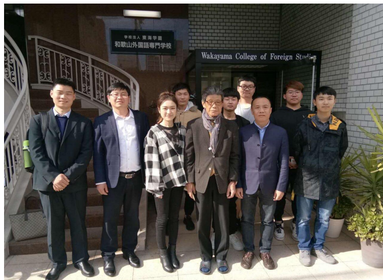
图 14 我校领导赴日本洽谈合作

交流学院院长带领学校领导到日本看望在我校已毕业学生。学校还将进一步深化与日本学校交流的广度和深度，有效拓展学生可选择的专业领域，加强学校国际交流建设。