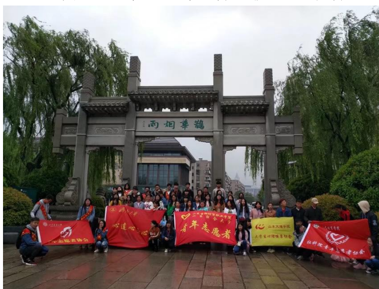
图6 “捡烟头，护环境”环保公益活动