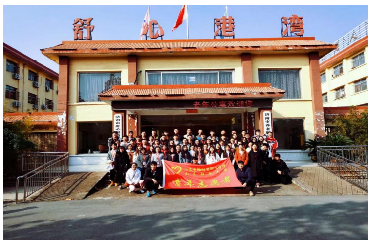
图5 “舒心港湾”养老院志愿活动